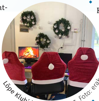
Lõpe Klubi jõulumeeleolus.

Tingi juhendamisel koos täiskasvanute teatristuudio