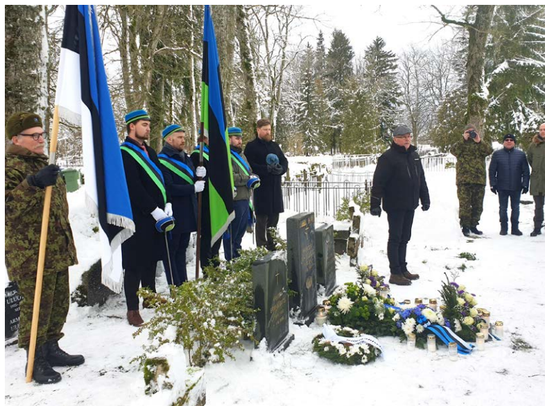
Kirblas sündinud Jüri Uluots oli aastatel 1940–1944 Eesti peaminister presidendi ametis.

Uluots suri Rootsis 9. jaanuaril ja maeti 13. jaanuaril 1945. 13. mail 2008 saabusid Uluotsa pere põrmud Eestisse ja maeti sama aasta 31. augustil Kirbla kalmistule.