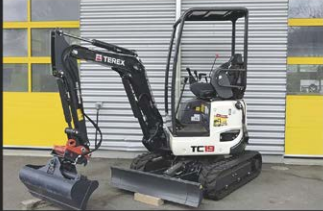
TEREX TC-19 MINI, 1,9 T