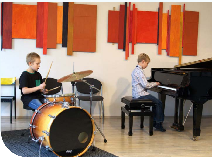
Muusikakoolis õpetatakse 13 erinevat muusikainstrumenti.