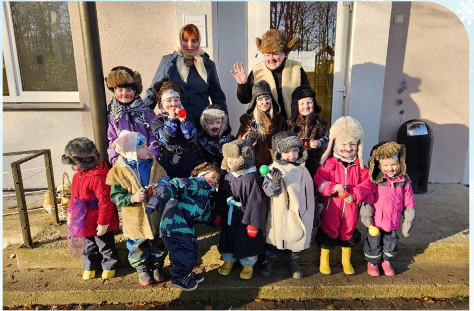
Virtsu väikesed ja suured mardid.