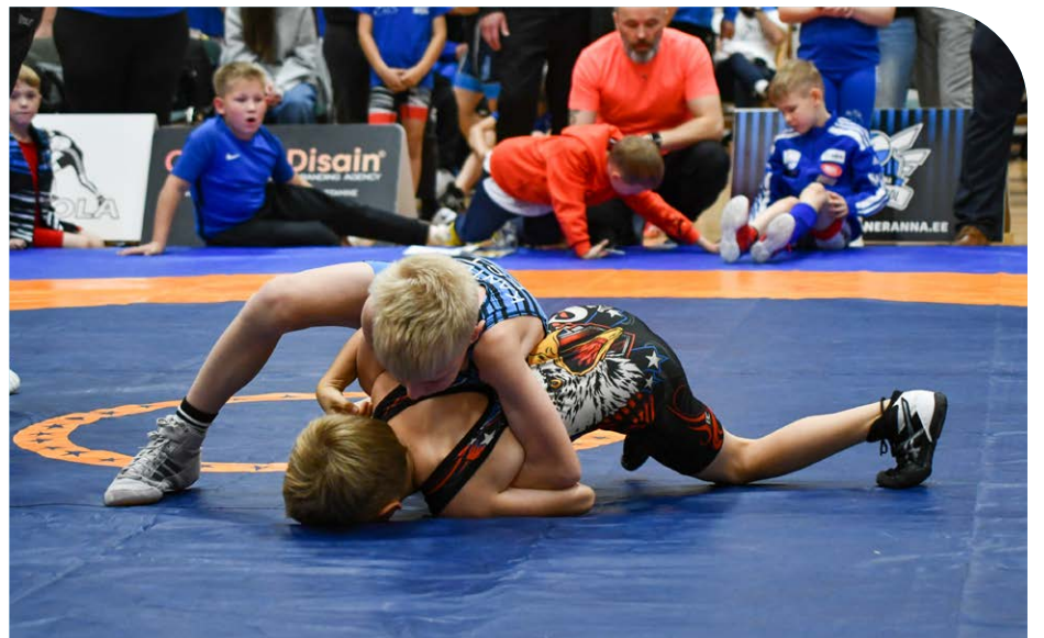
Lääneranna Spordikoolis toimuvad lastele jalgpalli ning lauatennise-, kergejõustiku- ja maadlustreeningud.