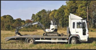
PUKSIIRTEENUS, KANDEVÕIME 3,5 TONNI