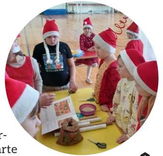
◀ Päkapikupäeval oli maja täis päkapikke.

Nüüd naudime talverõõme, aga ei unusta ka õppimist.