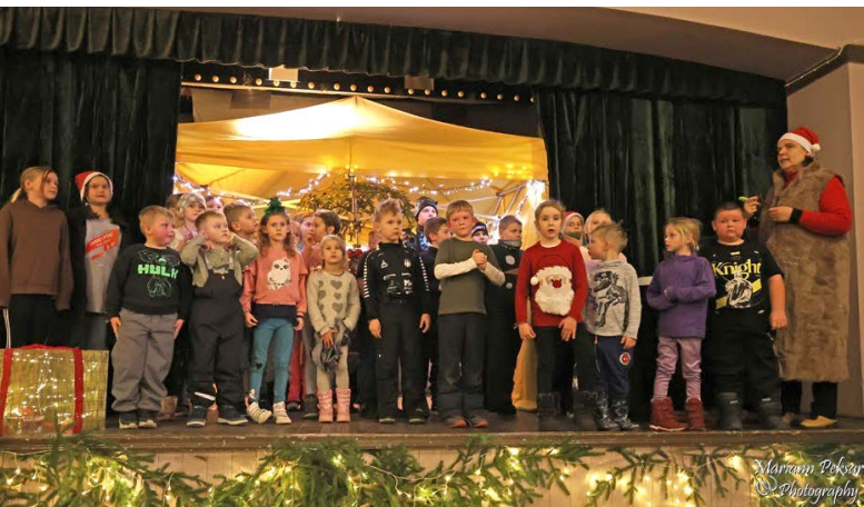
Etendus „Laanerahva jõuluõhtu“ jõudis publikuni kahel korral.

Lääneranna Gümnaasiumi näiteringi juhendaja ja õpetaja