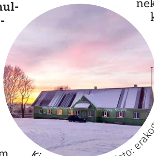
Kirbla rahvamaja.

Projekti eesmärk on osta Kirbla rahvamaja generaator ja välja ehitada ühendussüsteem, et oleks võimalik generaatorit kasutada. Samuti soetada generaatori hoistamiseks puidust tööriistakuur, kuna külaseltsil puudub ruum, kus saaks ilmastikukindlalt generaatorit hoida. Projekti toetusel ostetud generaatoriga tõstaksime