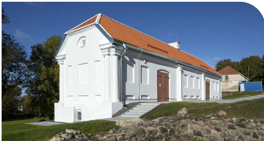
2024. aastal lõpetati Lihula mõisa viinaaida renoveerimistööd.