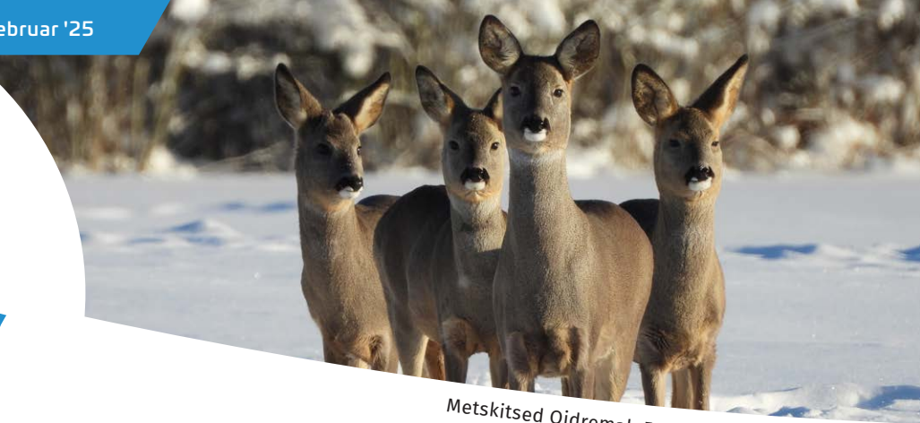
Metskitsed Oidremal.