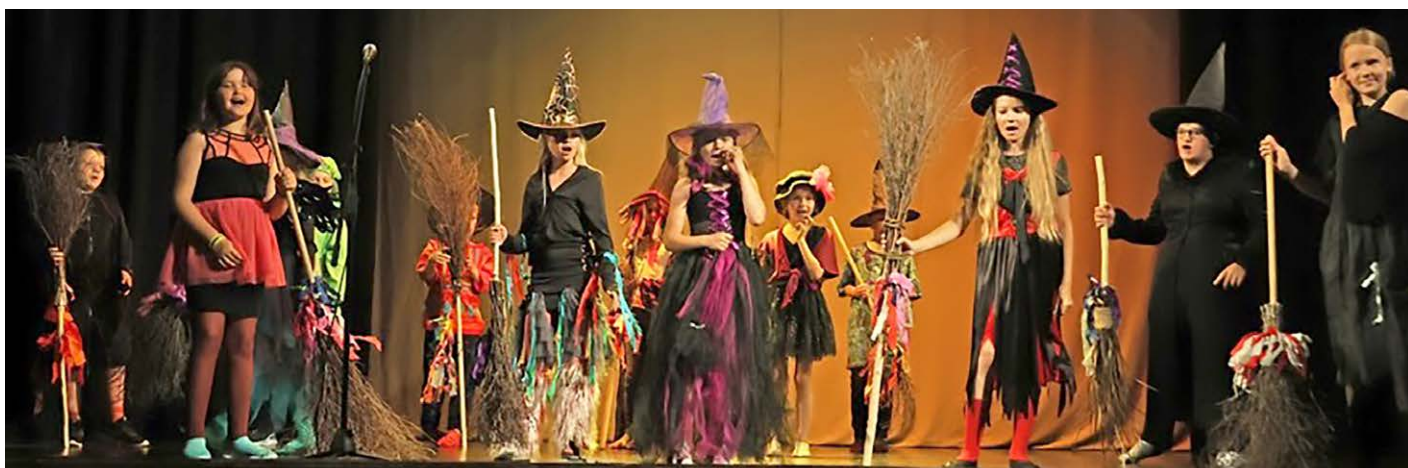
Kõmsi Lasteaed-Algkooli muusikal.