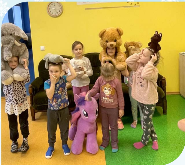
Kaisukarupäev Varblas.