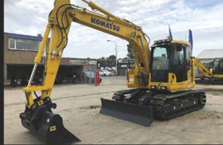
KOMATSU PC 138 US-8, 15 T