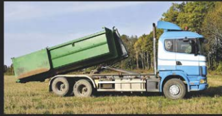
MULTILIFTI TEENUS, KANDEVÕIME 12 TONNI