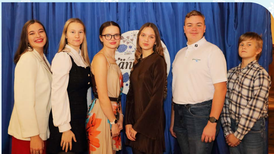
Novembris toimus noortevolikogu üldkogu, kus valiti uus koosseis.

projekti. Esimene oli „Õunte pealt“, milles saadi infotehnoloogiliste vahendite abil algteadmisi foto- ja videograafiast ja kodeerimisest. Teine oli Lääneranna aasta projektiks valitud „Kömsi perepäeva“ projekt, mille raames toimus neljas suur perepäev Kömsil. Kavas oli kastironimine, batuut, näomaalingud, foto-box, maskotid, Kaitseliidu viburada, ponid ja Lõpe noortetoa noortega koostöös toimunud kepphobuste võistlus