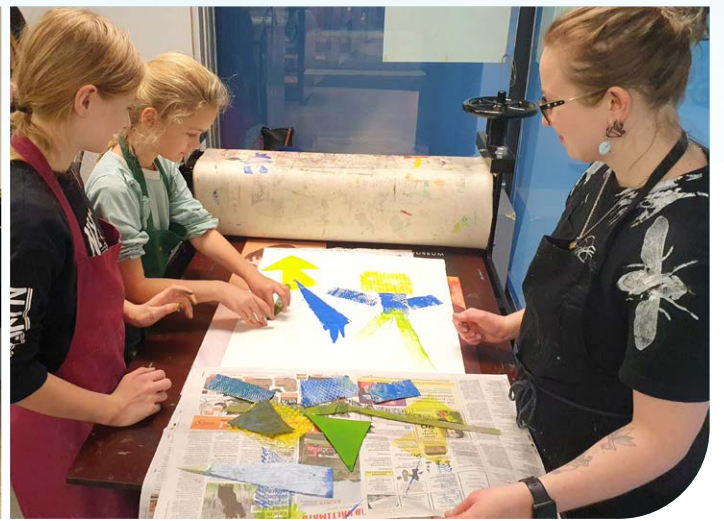
Kunstikooliga graafika töötoas.