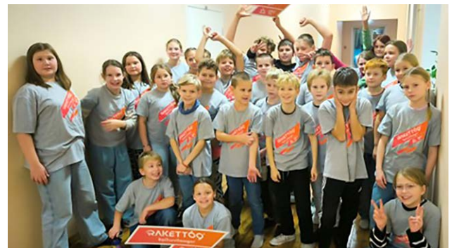
Laagris osalesid Lihula, Kõmsi ja Varbla õpilased.

Lisaks erinevatele võistlusülesannetele, said omavahel paremini tuttavaks erinevate tegutsemiskohtade õpilased, sest lisaks Lihulale, olid laagris ka Kõmsi ja Varbla õpilased.