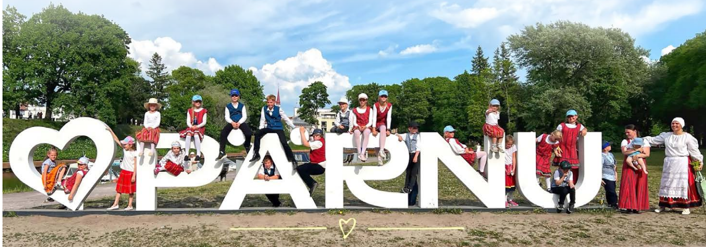
Kõmsi Lasteaed-Algkooli lapsed maakondlikul laulu- ja tantsupeol.