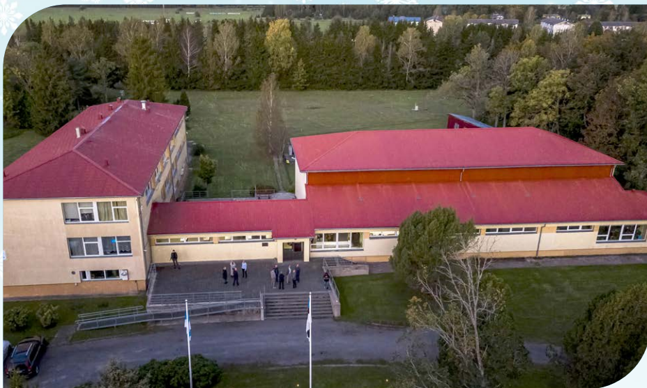
Koonga kool.