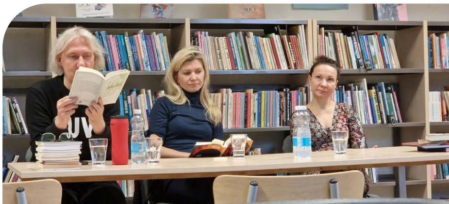
Sõnaränd, Eesti kirjanike autoriõhtu Lihula Keskraamatukogus.