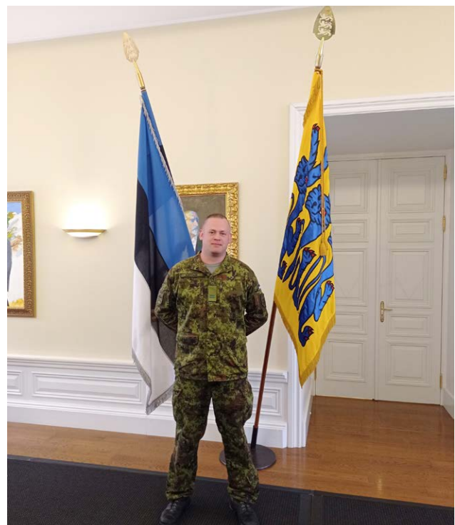
Kaitseliidus saad omandada teadmised ja oskused, kuidas nii sõja- kui ka rahuajal erinevates olukordades tegutseda.

Tänapäeval on Lihula üksikkompanii osa Kaitseliidu Lääne malevast, kandes edasi isamaalisi traditsioone ja panustades kohaliku kogukonna kaitsevõime tugevdamisse. Lisaks militaarsetele ülesannetele osalevad liikmed ka kohalikel üritustel, edendades patriotismi ja kogukonna ühtsustunnet.