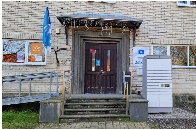
Raamatukapp võeti kasutusse 1. novembril.