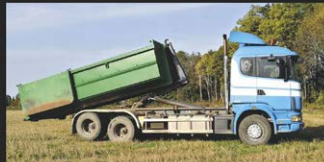
MULTILIFTI TEENUS, KANDEVÕIME 12 TONNI