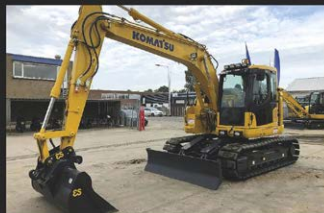
KOMATSU PC 138 US-8, 15 T