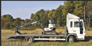
PUKSIIRTEENUS, KANDEVÕIME 3,5 TONNI