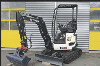
TEREX TC-19 MINI, 1,9 T